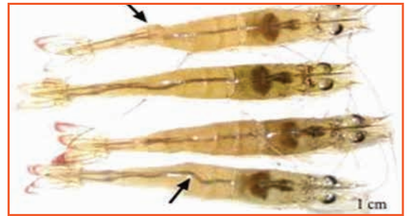
Thân tôm biến dạng