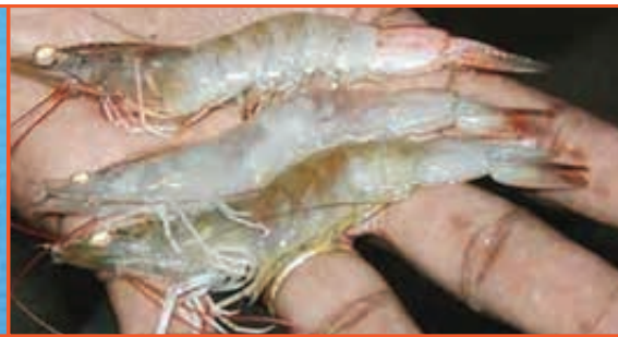
Tôm thể nhiễm bệnh hoại tử cơ ( cơ màu trắng đục)