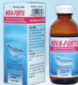
Tăng sức đề kháng