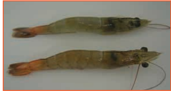
Tôm nhiễm bệnh nặng, đốt bụng cuối của tôm chuyển sang màu cam