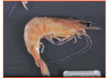
Râu cong queo