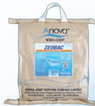
Men vi sinh xử lý đáy ao