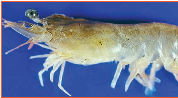
Ngoại hình dị dạng của tôm thẻ nhiễm IHHN