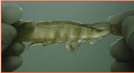
Bệnh IMNV ở giai đoạn đầu: các vùng mờ đục xuất hiện trên các đốt bụng của tôm