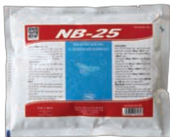
Men vi sinh cao cấp xử lý ao ô nhiễm