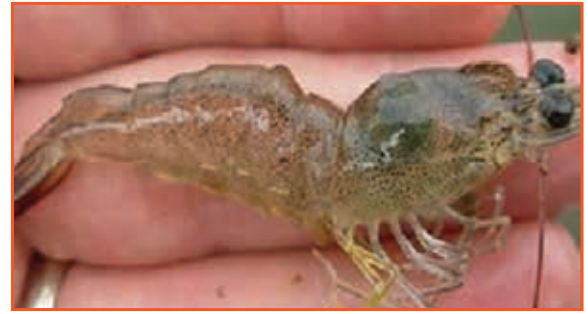
Tôm biến dạng, chậm lớn