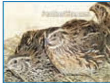
Hình 3: Chim cút Nhật Bản lúc trưởng thành