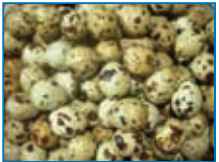
Hình 1 Trứng chim cút Nhật Bản

- Người ta thường phân biệt giới tính chim cút sau 2 tuần tuổi khi các khác biệt về giới tính bắt đầu được biểu lộ. Thông thường, toàn bộ chim cút trống và chim mái không đạt chuẩn sẽ được nuôi thịt.