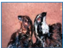
Hình 11: Giống cút Bobwhite bị nhiễm vi-rút bệnh đậu

Cút ốm gầy, nổi mụn đậu trên da, viêm cata ở niêm mạc miệng, thanh quản. Các vết viêm này loang dần thành các nốt phỏng, dày dần lên cuối cùng tạo thành lớp màng giả dính chặt vào niêm mạc. Niêm mạc ruột có thể tụ máu đỏ từng đám. Phổi tụ máu và tích nước, khí quản chứa nhiều dịch xuất lẫn bọt.