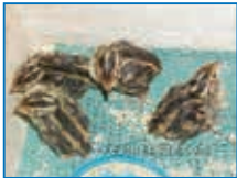
Hình 2 Chim cút Nhật Bản lúc mới nở